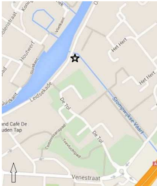
Afb. 1. De onderzoekslocatie op de hoek van de Leidsekade en de Starrevaart in Leidschendam.

In september 2007 is door de AWLV een kort archeologisch onderzoek gedaan bij het bouwrijp maken van een perceel aan de Leidsekade 39 op de hoek van de Starrevaart in Leidschendam (afb. 1). Uit een archeologisch vooronderzoek door het bureau RAAP was gebleken, dat de archeologische waarden van het terrein niet zodanig waren dat een professioneel onderzoek noodzakelijk was. Omdat er bij het vooronderzoek wel scherfmateriaal was gevonden, beval de gemeente Leidschendam-Voorburg de ontwikkelaar van het terrein een onderzoek door de werkgroep aan. De mogelijkheden voor onderzoek door de AWLV waren echter beperkt, omdat het terrein flink verontreinigd was.