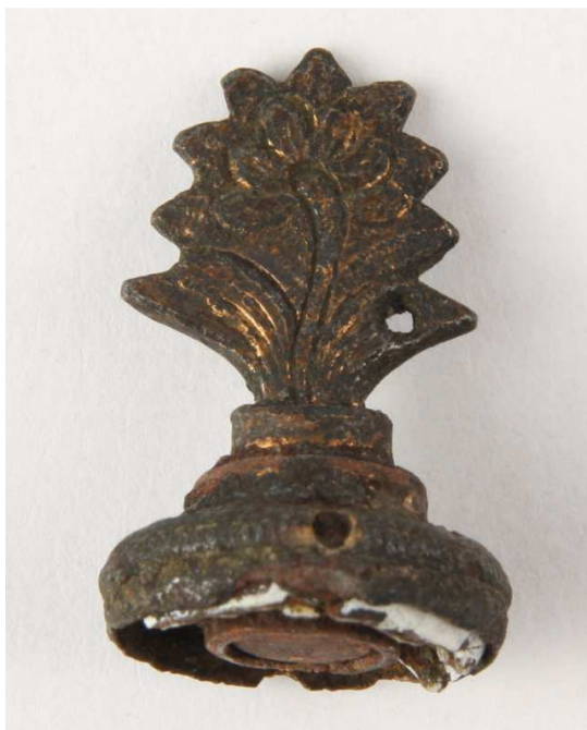
Afb. 12. Houdertje van een zegelstempel met de afbeelding van een bloem.

Het houdertje van het zegelstempel (25 mm hoog en 15 mm diameter) toont een bloem. Helaas is het zegel zelf verdwenen (afb. 12).