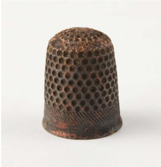
Afb. 13. Vingerhoed.

De vingerhoed is van messing. Hij is geheel bedekt met putjes op de onderste rand na die is versierd met twee banden met diagonale streepjes (afb. 13). Qua toegepaste techniek kan de vingerhoed in Neurenberg gemaakt zijn, dat vroeger een belangrijke productieplaats van messing voorwerpen was. 6