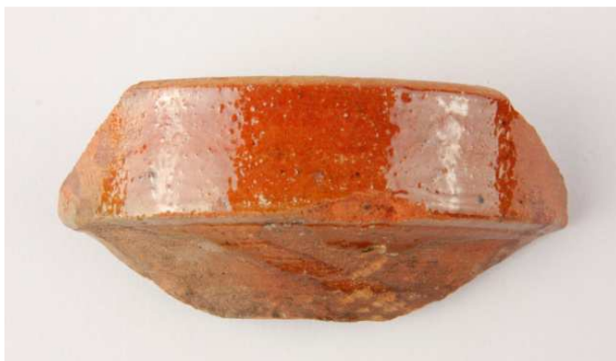
Afb. 6. Vogeldrinkbakje.

Er zijn twee grotere fragmenten en wel van een grape (afb. 5) en van een pot. De grape heeft een schuin oplopende wand, een ronde steel en een diameter van 30 cm, en is alleen van binnen geglazuurd. Op de bodem zitten roetsporen. Hij is te dateren in de 18e eeuw. 2 De pot heeft een standing van 16 cm en is gezien de grootte mogelijk voor opslag gebruikt. Verder is er een bakje met een diameter van ongeveer 8 cm, waarvan de binnenzijde en de opstaande buitenrand zijn geglazuurd. Dit is waarschijnlijk een vogeldrinkbakje (afb. 6).