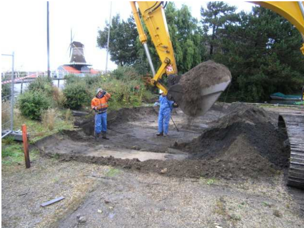
Afb. 15. De locatie van het onderzoek ligt schuin tegenover de houtzaagmolen De Salamander.

Op het minuutplan van de gemeente Stompwijk uit 1819 staat een gebouw. In de loop van de 19e en 20e eeuw wordt deze bebouwing blijkens latere kaarten aan de noordzijde uitgebreid. Mogelijk is het puin dat RAAP bij de boringen heeft aangetroffen van deze bouwsels afkomstig. De AWLV vond bij haar onderzoek drie waterputten die op gebruik van het terrein wijzen. Over de aard van de bebouwing kon echter geen duidelijkheid worden verkregen.