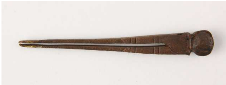
Afb. 10. Messing steekpassertje.

Het messing steekpassertje is 63 mm lang en is aan weerszijden versierd met horizontale en diagonale streepjes (afb. 10).