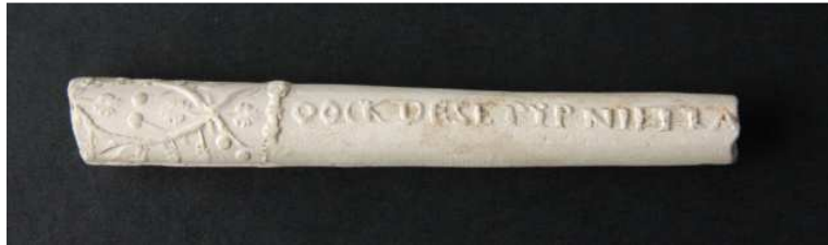
Afb. 7a en b. Voor- en achterzijde van de steel van een pijp met Oranje propaganda.