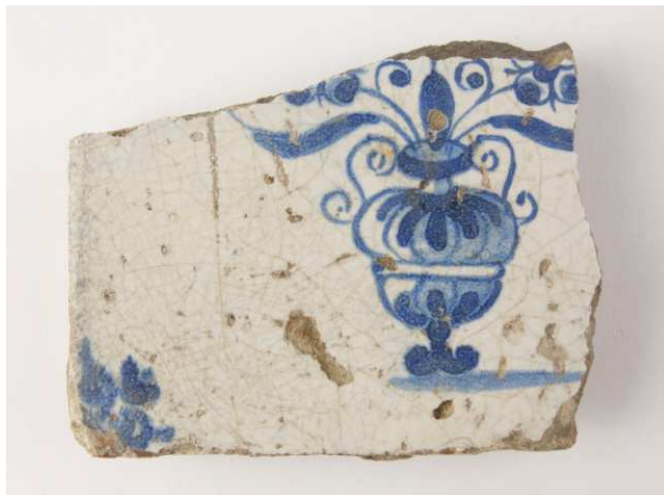
Afb. 8. Fragment van een tegel uit de 17e eeuw.

Er is slechts één glasfragment gevonden en wel een flesbodem met een ziel.