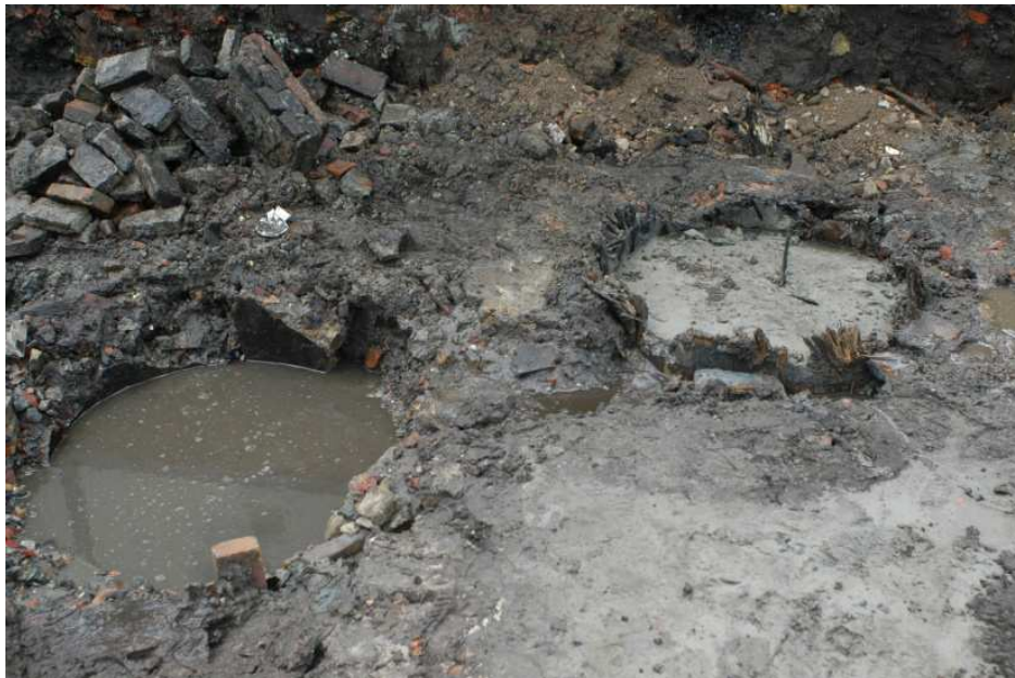
Afb. 3. Waterputten.

In de proefsleuf werden scherven van aardewerk verzameld en botmateriaal (afb. 4). Ook is een leren schoen gevonden. Verder zijn met een metaaldetector kleine metalen voorwerpen getraceerd.