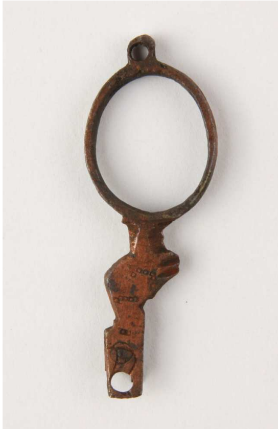
Afb. 11. Fragment van een koperen schaar met een gestileerde afbeelding van een vogel.

Van de koperen schaar is alleen het onderste stuk van een van de twee samenstellende delen gevonden. Tussen de ring en de aanzet van het knipgedeelte is een gestileerde afbeelding van een vogel (afb. 11).