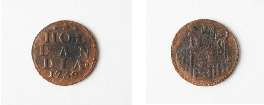
Afb. 9a en b. Koperen duit van 1739 uit de provincie Holland.

De munt is een koperen duit van 1739 uit de provincie Holland. Op de voorzijde staat 'HOLLANDIA 1739' en op de achterzijde is een omheinde tuin afgebeeld met een leeuw die een stok vasthoudt met daarop een hoed (afb. 9a en b).