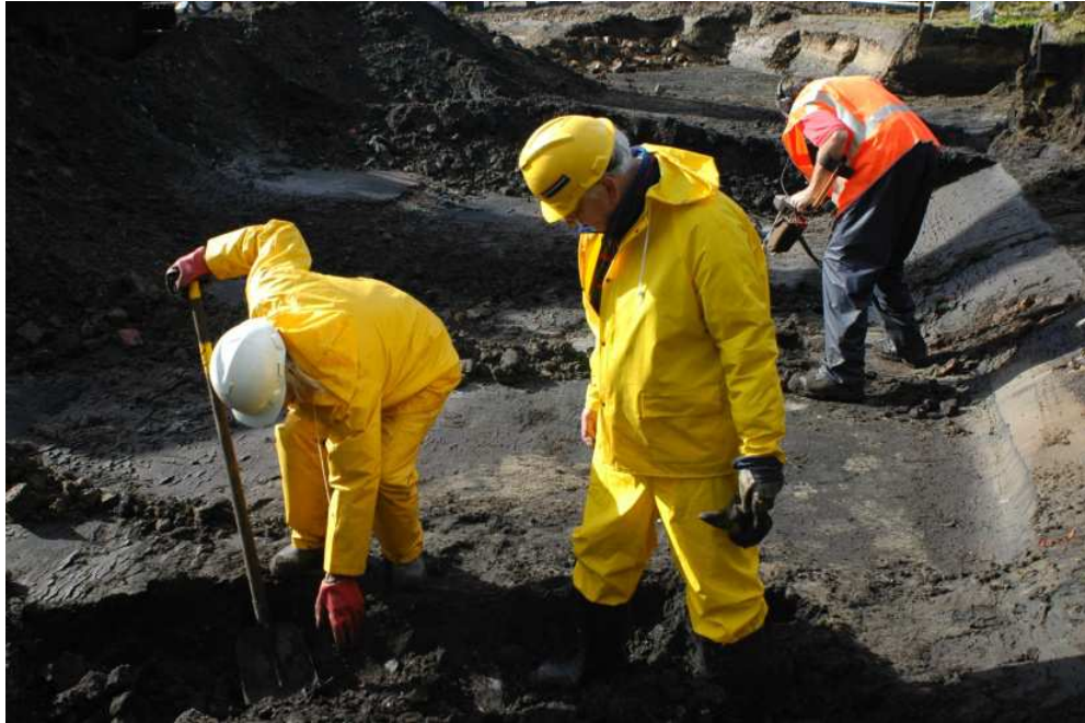
Afb. 4. Archeologisch onderzoek door leden van de AWLV.