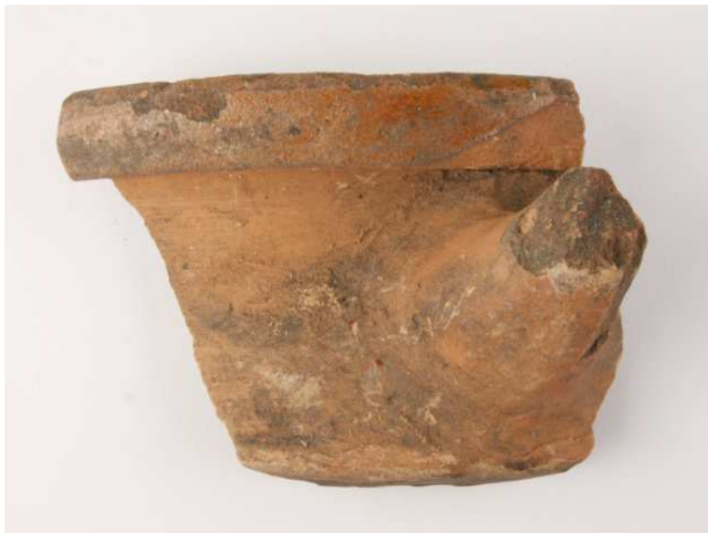
Afb. 5. Grape uit de eerste helft van de 18e eeuw.

Van de onversierde geglazuurde roodbakkende fragmenten zijn 32 afkomstig van een pot, vijf van een grape (een kookpot op drie poten), drie van een bord en twee van een kom of kop. De met slibversierde scherven zijn daarentegen in hoofdzaak afkomstig van borden (26 stuks), terwijl slechts enkele van een kan, kom, kop of pot zijn geweest.