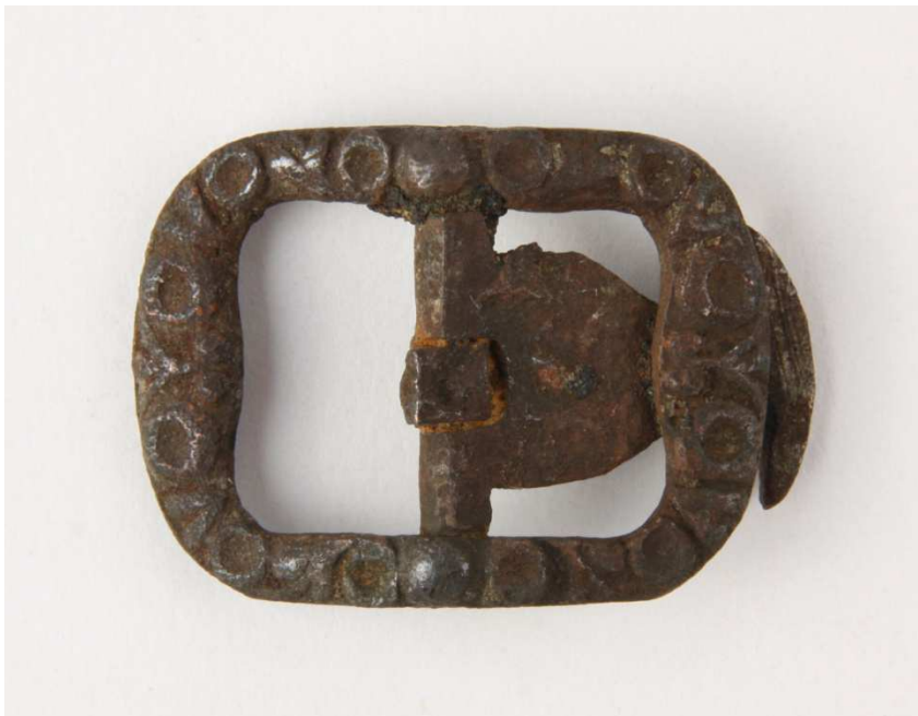
Afb. 14. Gedecoreerde gesp.

Van de drie knopen is er een hol en zijn er twee massief. Ze hebben alle een oogje om aan kleding te bevestigen. De kleinste knoop heeft op de voorzijde een floraal decor, terwijl er op de achterzijde letters staan ('MARIA?').